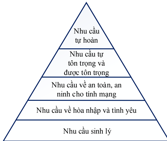
Sơ đồ 1.1 : Các bậc thang nhu cầu theo lý thuyết nhu cầu con người của Maslow